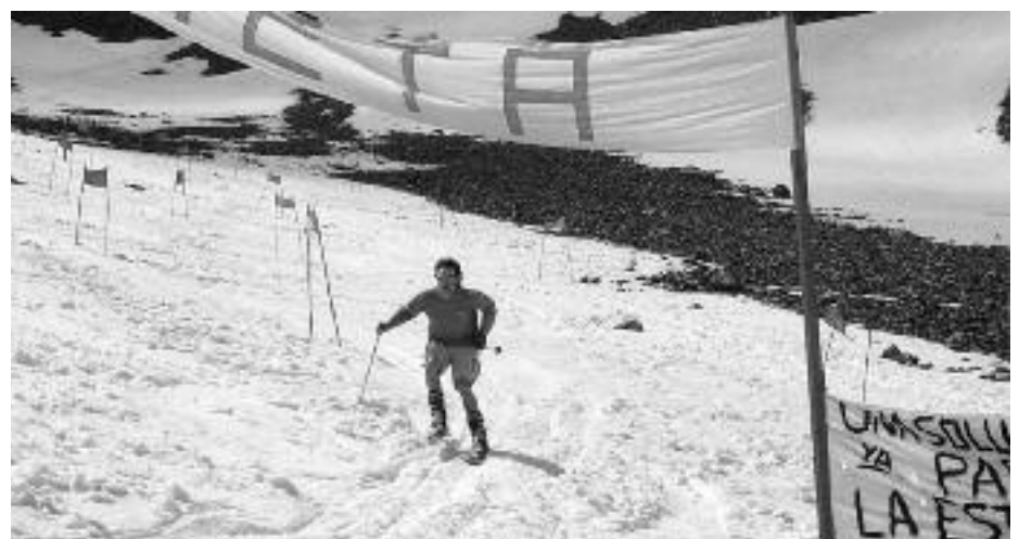
Proyecto de estación de esquí en junio.

Pese a que la Montaña disfruta de un turismo estival cada vez más consolidado y del que este verano 2009 es una muestra en plena crisis, carecemos de sistemas modernos de gestión de la oferta del tipo de una central de reservas o de ofertas integradas entre los establecimientos.