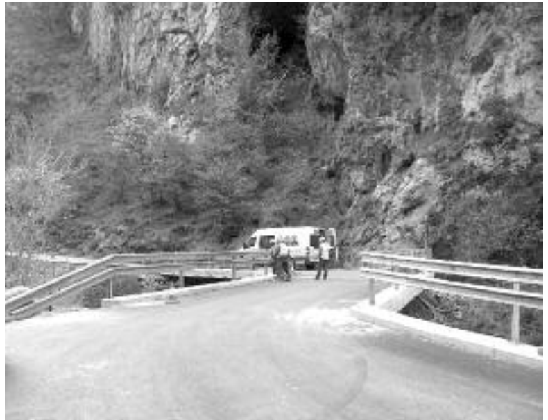
Nuevo Puente de Cancelis en la carretera de Caín.

A medida que ha ido discurriendo el año 2009, varias de las obras más importantes llevadas a cabo en la Comarca llegan a su fin, bien por verdadera finalización, bien por el temor de los directores de obra a adentrarse en el invierno con lo que ello supone en una zona montañosa como la nuestra, aunque este año hay que agradecerle al invierno que esté dando un respiro hasta el momento y los trabajos estén siendo prolongados hasta bien entrado noviembre, con bastante buen tiempo para esas fechas.