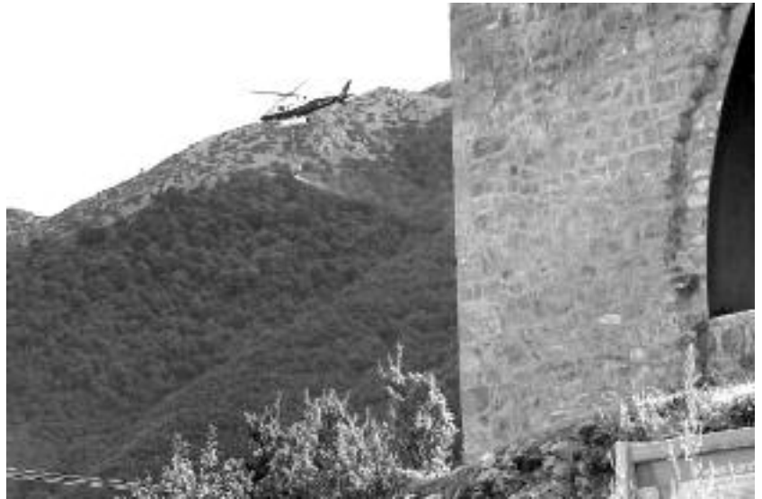
Helicóptero cargado de agua en Lavilla.

El Ministerio del Interior aprobó el pasado octubre las ayudas a los municipios afectados por incendios forestales producidos durante los meses de junio, julio y primeros de agosto del 2009. El Alcalde de Boca Tomás de la Sierra había solicitado ayudas para paliar los daños del incendio clasificado como intencionado por la Consejería de Medio Ambiente que el pasado 17 de agosto carbonizó 500 hectáreas de monte bajo en los términos de Barniedo y en menor medida de Portilla de la Reina. Una vez publicada la orden en el BOE corresponde a la Dirección General de Protección Civil y Emergencias la elaboración de los términos municipales y núcleos de población susceptibles de beneficiarse de las medidas contempladas en el Real Decreto-ley 12/2009, de 13 de agosto.