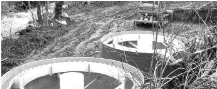
Fase de construcción de la depuradora de Soto de Valdeón.

El horizonte final de este asunto se vislumbra tras la adjudicación a una empresa del mantenimiento de las depuradoras, así como la entrada en funcionamiento de la central colectora de lodos, situada en Riaño y cuyos concejales manifestaron en el último pleno municipal sus dudas sobre quién pagaría el mantenimiento de la planta de tratamientos de lodos, insinuando la posibilidad de solicitar una compensación por este menester.