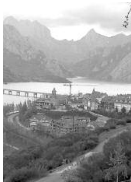
La residencia en primer término (arch)