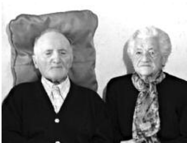
El matrimonio en una foto de Santiago.