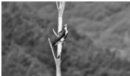
Águila pescadora en Salio.

Evidentemente estas frías y profundas aguas poco pueden ofrecer a aquellas especies que necesitan de zonas someras para criar y alimentarse, pero son sin duda un buffet libre para todas aquellas aves que se alimentan de peces, como es el caso de cormoranes, somormujos, zampullines, garzas, garcetas y águilas pescadoras.