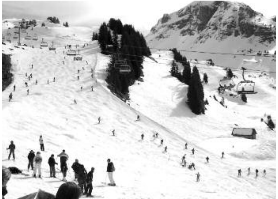
Estación de esquí francesa en campaña.

Bien pues esto es una muestra media (ni la más barata ni la más cara) de