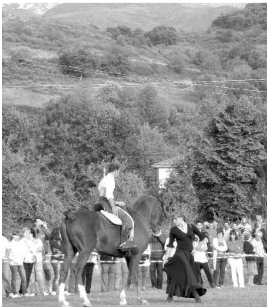
Espectáculo de doma en la feria de Posada.

Decir que la esencia de una feria ganadera reside en el ganado es una obviedad, pero conviene recordarlo porque el reclamo continúan siendo las reses y se siguen denominado ferias. Es casi seguro que sería positivo algo de trabajo y reflexión sobre este tipo de eventos por parte de los organizadores, pues reconducir situaciones según cambian las circunstancias suele ser sinónimo de éxito.