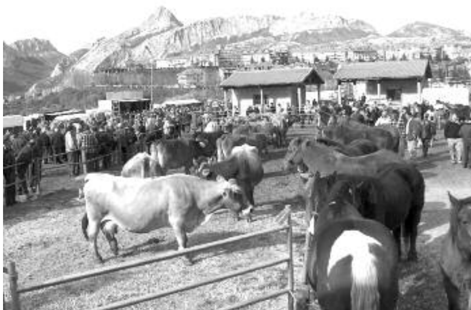
Feria de Riaño (archivo).