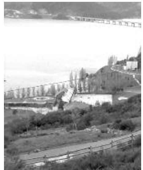
Edificio de las piscinas (archivo).