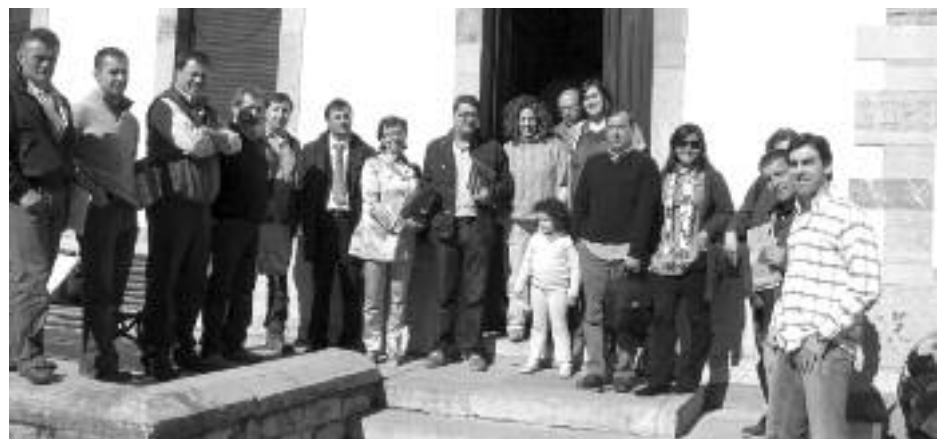
Asociación de Turismo de Oseja.

Desde la Revista Comarcal deseamos el mejor de los futuros para esta nueva asociación.