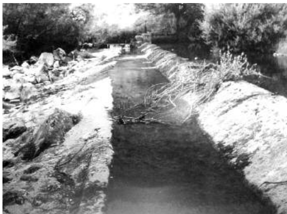
Puerto de Villafrea de la Reina.

progresivamente en su curso superior. Eso hace que puentes como el de Villafrea tengan asegurados los cimientos de sus