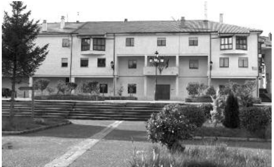
Plaza del Ayuntamiento de Riaño en una foto de archivo.