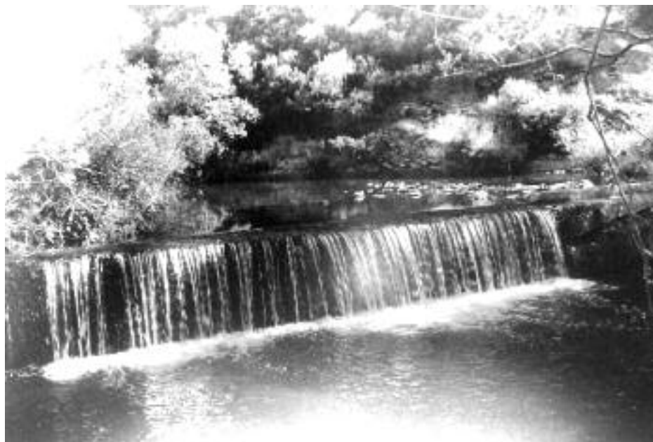
Puerto de “La fábrica de la Luz”, Portilla.

Yo lo llamaría los “puertos mixtos” a la solución intermedia que proteja ambos intereses. Estos puertos llevarían un encofrado firme que no sobrepasara el nivel del lecho natural del río, lo que impediría el ahondamiento del cauce para bien de los puentes. De esta base sobresaldrían dos o más machones en los que se podrían colocar tablones de madera o metálicos para retener el agua en las épocas de riego. En otoño se retirarían los tablones para que se conserve el lecho original del río. Esa solución intermedia sería también útil para dar más amplitud o profundidad a las zonas de baño.