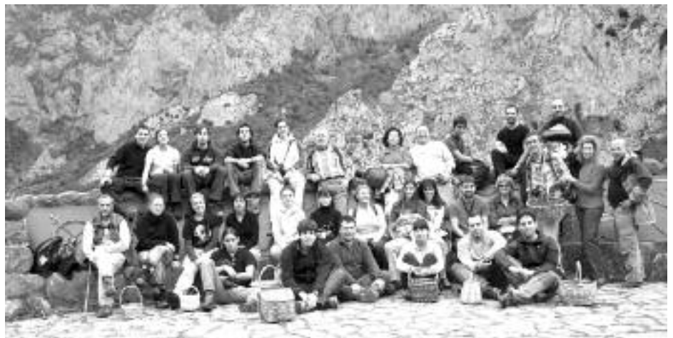
Curso de aprovechamientos micológicos.

El Aula Picos de Europa ha recibido este año más de ciento cincuenta alumnos en los cinco cursos impartidos, contando todos ellos con una valoración importante por parte de los participantes.