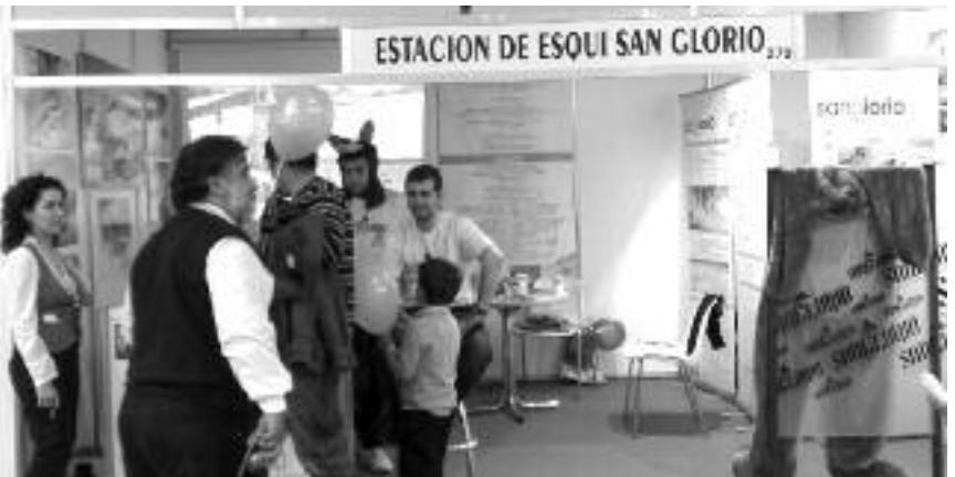
Stand de la nueva asociación en la feria de turismo de Castilla y León.