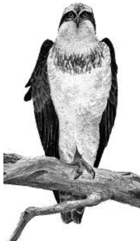
Dibujo: Luis Frechilla.

Las aves adultas a menudo realizan el viaje por alta mar y sin realizar apenas paradas pero las aves jóvenes e inexpertas tienden a migrar cerca de las