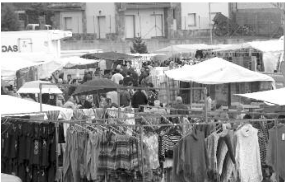
Feria de Riaño (archivo).

Debí ponerme colorado por aquel sentimiento de pensar que quizás no podría responder a las expectativas que en mí ponía el maestro, como si toda la honra familiar dependiera de mi insignificante persona. Pero yo había oído las conversaciones de los mayores por aquellos días y hablaban de la feria de Riaño,” la feria de noviembre “, expresión oída muchas veces desde meses