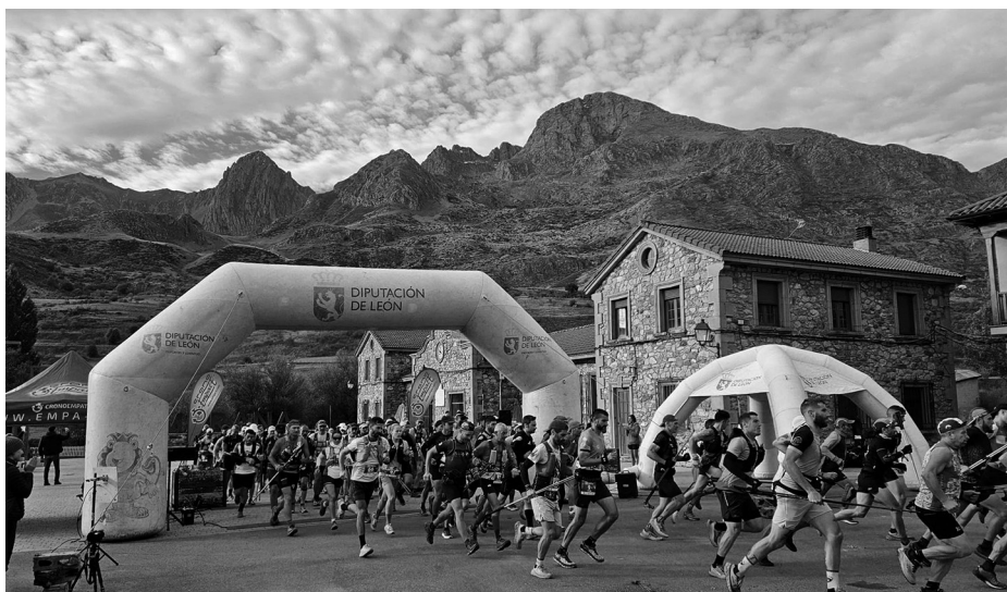
Salida del VIII Trail de Mampodre.

La prueba reina, con 19 kilómetros y 1.400 metros de desnivel positivo, llevó a los casi 200 participantes inscritos a recorrer las difíciles verdades del imponente Macizo de Mampodre, un escenario donde la naturaleza se muestra tan dura como espectacular. El clima se alió con los corredores: temperaturas frescas a primera hora, cercanas a los 5 grados, y un máximo de 19 al mediodía, ofrecieron unas