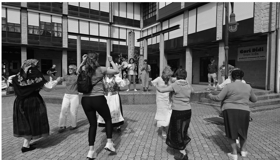
Actuación del grupo de pandereteras Ruxideira.

La música tradicional tuvo un papel destacado en esta segunda edición de la Hila Social gracias al grupo de pandereteras Ruxideira, que animó la mañana con actuaciones y recordó la importancia de la pandereta como símbolo de la música popular, además de los talleres gratuitos que imparten en la villa, que ha dado lugar a la formación de un grupo de panderetas en la co-