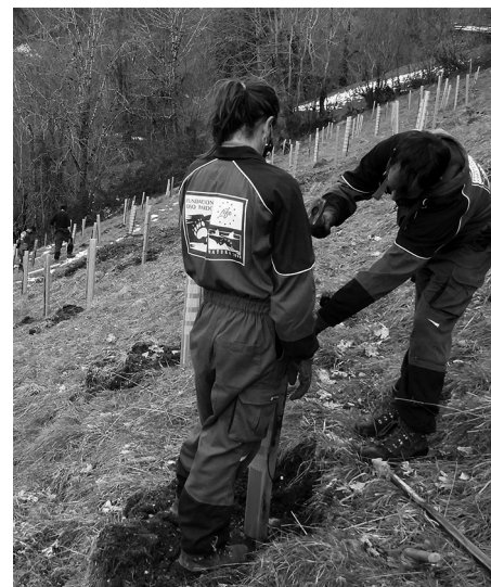
Plantación de especies no pirofitas (cortafuegos verdes).

El documento concluye que solo a través de la implicación activa de la sociedad y de un compromiso firme de las instituciones se podrán afrontar los nuevos escenarios de incendios, cada vez más intensos y complejos.