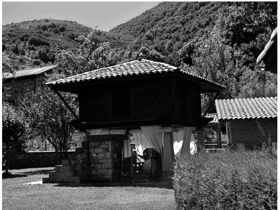
Hórreo en Posada de Valdeón, propiedad de la familia Alonso Cuesta.

Este impulso nacido en Asturias, donde se calcula un patrimonio de entre 15000 y 20000 hórreos, añadiendo paneras y cabazos, se extendió a otras comunidades, desde Galicia hasta León, Cantabria, País Vasco y Navarra, e incluso a Portugal. Así nació la Red Internacional Hórrea, una plataforma que reúne a asociaciones, expertos y defensores de los graneros