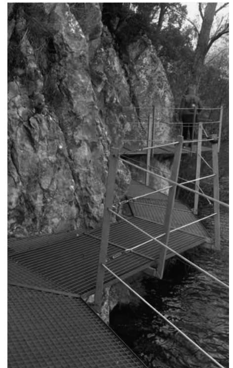
Aspecto de las plataformas metálicas proyectadas.

blandas que redistribuyan el turismo por toda la Comarca? Si un turista se aloja en Riaño seguramente no visitará otros pueblos; si se aloja en otros pueblos seguramente visitará Riaño. Hay que extender al resto de la Comarca el auge turístico de Riaño, pero cuidado: hay que ordenar ese turismo en un entorno que sigue siendo frágil. La Junta ha pasado sin transición de querer que la Montaña fuera un cortijo cinegético a querer convertirla en un parque temático para turistas. Esperemos que reine la cordura. Bachende no necesita más profanaciones.