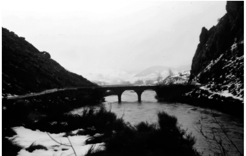
Antiguo puente de Bachende.