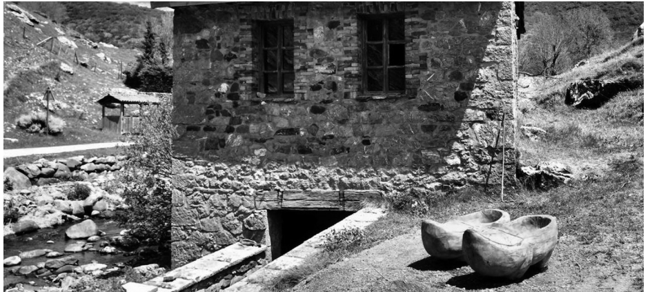
Los madreñones de Casasuertes.

Me deja dubitativo un momento, entre sorprendido y seguro de ser objeto de una broma. Fui hace tiempo a Casasuertes en invierno a registrar la población existente para el libro que después fue publicado: “Censo de Invierno”. Solo quedaba allí un matrimonio que sumaba más de ciento cincuenta años. Apegados a la tierra,