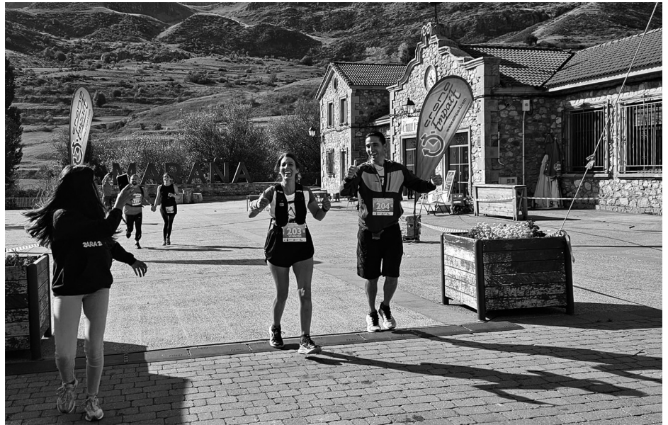
Participantes llegando a la meta.

El Trail de Mampodre es una prueba deportiva muy técnica de gran dificultad, no solo por su longitud, sino también por los grandes desniveles que tienen que salvar los deportistas. “La parte más técnica está en la primera parte. Se trata de un kilómetro casi vertical hasta alcanzar la Peña de la Cruz, a 2192 metros de altura. Desde allí se accede al Valle de Valverde